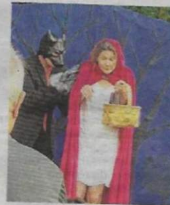
Le Petit Chaperon rouge et le grand méchant loup. PHOTO DE

L'équipe du moulin du Duellas prépare déjà activement ses prochaines animations qui se dérouleront jeudi 25 juillet à 22 heures avec une séance de cinéma en plein air au cours de laquelle se-